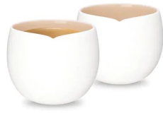
Set da 2 Origin Collec...