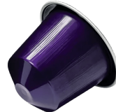
Ispirazione Firenze Ar...