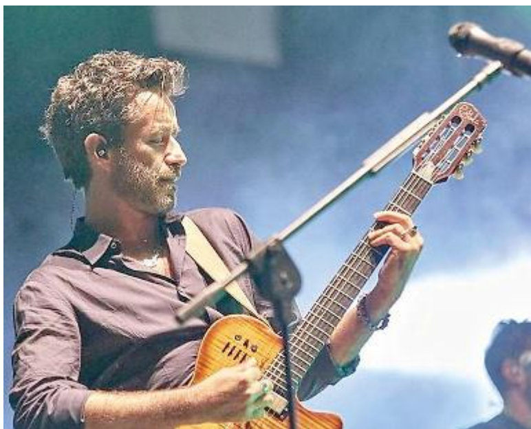
CANTAUTORE Daniele Silvestri salirà sul palco oggi alle 22 con un concerto unico, pensato esclusivamente per Festambiente

SPETTACOLI OGNI GIORNO RICCO CALENDARIO DI EVENTI PER TUTTE LE ETÀ'