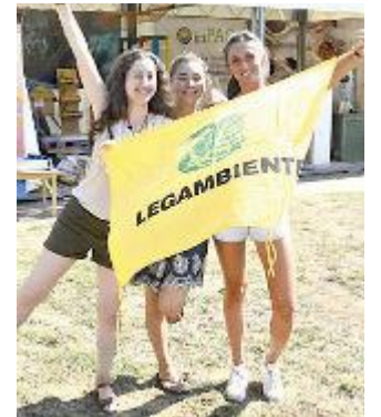
Volontari al lavoro