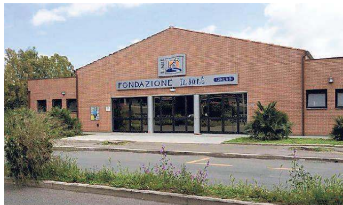
La sede della Fondazione Il Sole in via Uranio

«Abbiamo preso atto della difficoltà da parte del Sole di ottemperare agli obblighi sul canone e per questo abbiamo cercato una soluzione che svincolasse la fondazione da questo "gravame" accumulato negli anni - spiega-