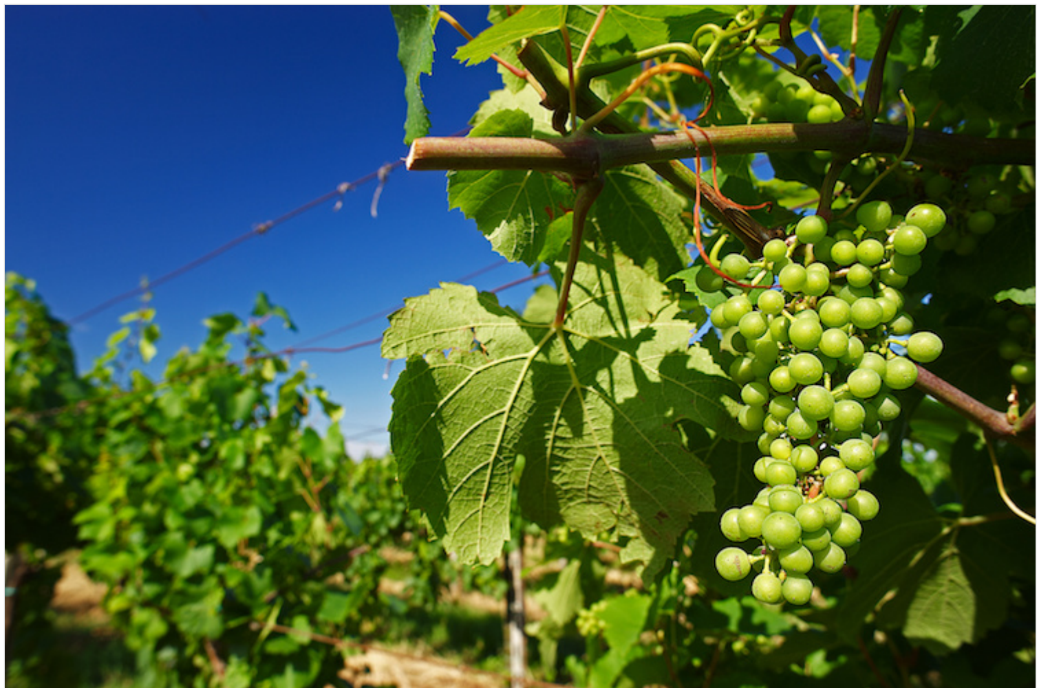
Pitigliano (Gr), 13 gennaio 2018

Il convegno si terrà il prossimo 13 gennaio a Pitigliano (Gr). Ore 10.00 nella sala Petruccioli della Fortezza Orsini